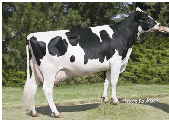
SEAGULL-BAY OMAN MIRROR FIFTH DAM